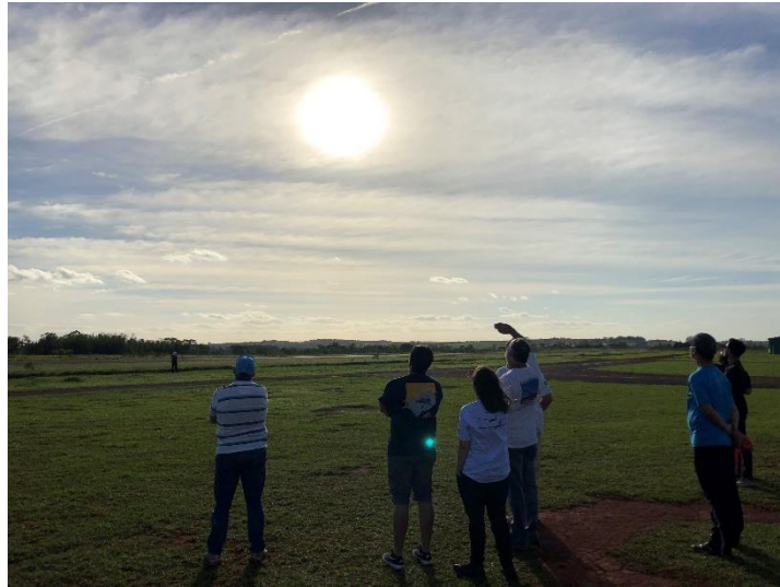
Participantes do Workshop praticando as técnicas de julgamento.

das manobras no planador, Christiano Oliveira realizou voos de demonstrações da sequência de manobras em sua aeronave de acrobacia avançada, o Extra 300 que um dia fez parte da esquadrilha da fumaça chilena, os Halcones . A aeronave experimental de acrobacia realizou voos de demonstração que foram usados como prática de julgamentos para a formação de juízes de competição.