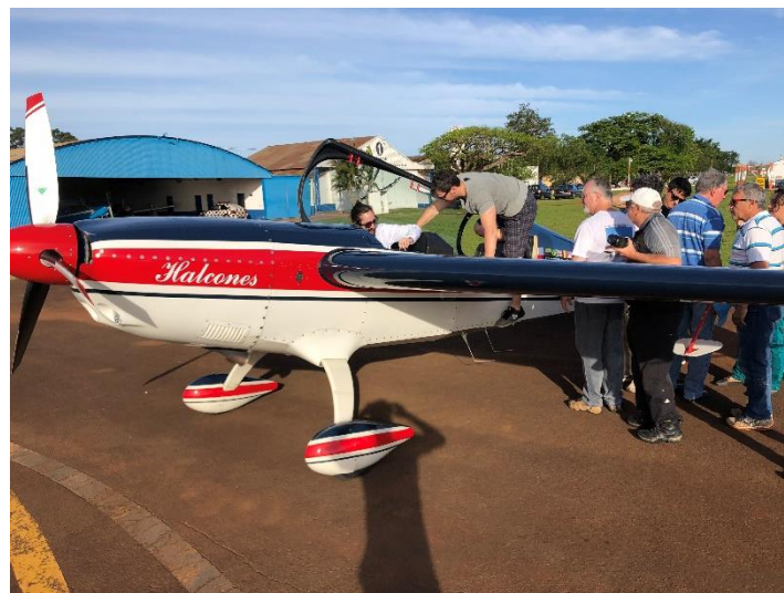
Aeronave acrobática realizando demonstrações para treino de juízes.

No dia seguinte, a meteorologia se demonstrou mais favorável para as acrobacias no planador, e então os participantes puderam praticar a sequência de manobras em voo. Acontecerão mais versões desse workshop, até que se possa formar a primeira equipe de treino de acrobacia em Tatuí, a qual irá buscar por organizar uma competição no aeródromo municipal. Essa competição poderá ser a primeira de acrobacia de planadores no Brasil.