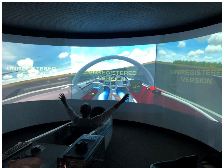
Simulador de voo utilizado para práticas acrobáticas.