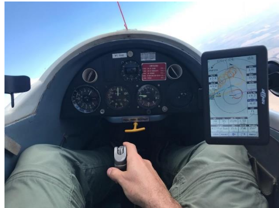
Imagem interna da cabine do planador PT-PHE e de um dos voos de competição de Henrique Gudin, nas proximidades do Rio Grande (divisa dos estados de SP – MG).