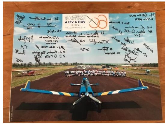
Grid de largada no 60º Campeonato Brasileiro de Voo a Vela e foto comemorativa dos participantes da competição.